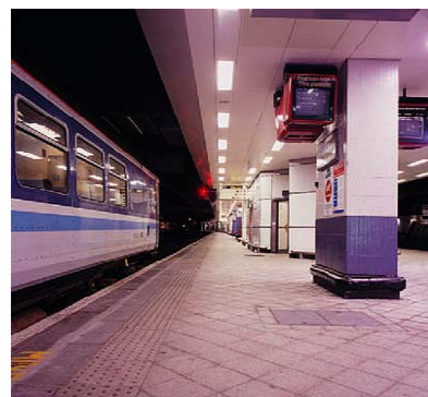
New Street Station Birmingham

Nur schon die Option, eine lebenslange Garantie abschliessen zu können, zeigt, wie qualitativ hochstehend dieses Produkt ist.