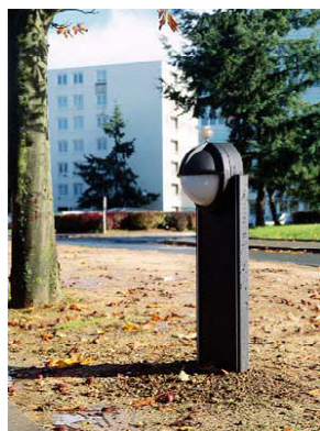
Mairie de Roissyen Park