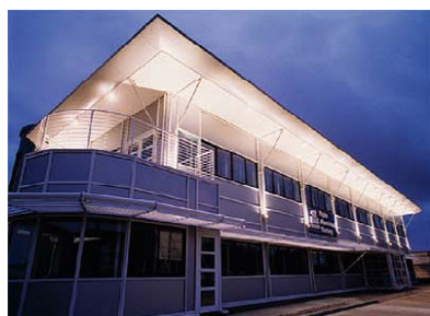
Hydro Aluminium Century Tyne & Wear

Antivandalenleuchten werden in folgenden Projekten bereits eingesetzt: